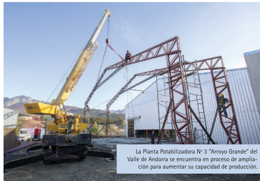
La Planta Potabilizadora N° 3 "Arroyo Grande" del Valle de Andorra se encuentra en proceso de ampliación para aumentar su capacidad de producción.

En enero se inauguró la Planta Potabilizadora N° 4, que ya abastece a todos los barrios de la zona oeste de la ciudad de Ushuaia. En forma paralela se comenzó a instalar un nuevo sistema de cloración en la Planta Potabilizadora N° 2 y a ampliar la Planta Potabilizadora N° 3 ubicada en el Valle de Andorra.