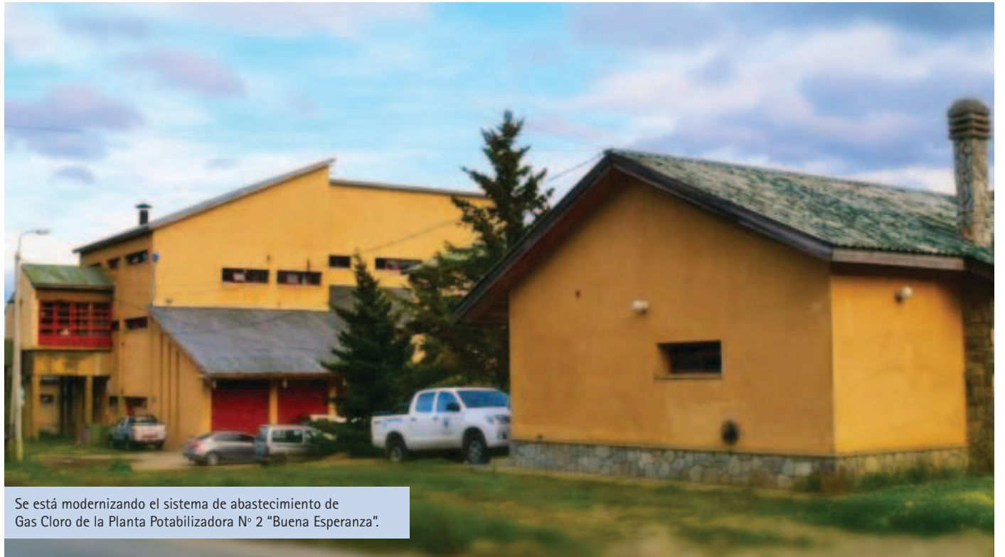
Se está modernizando el sistema de abastecimiento de Gas Cloro de la Planta Potabilizadora N° 2 "Buena Esperanza".