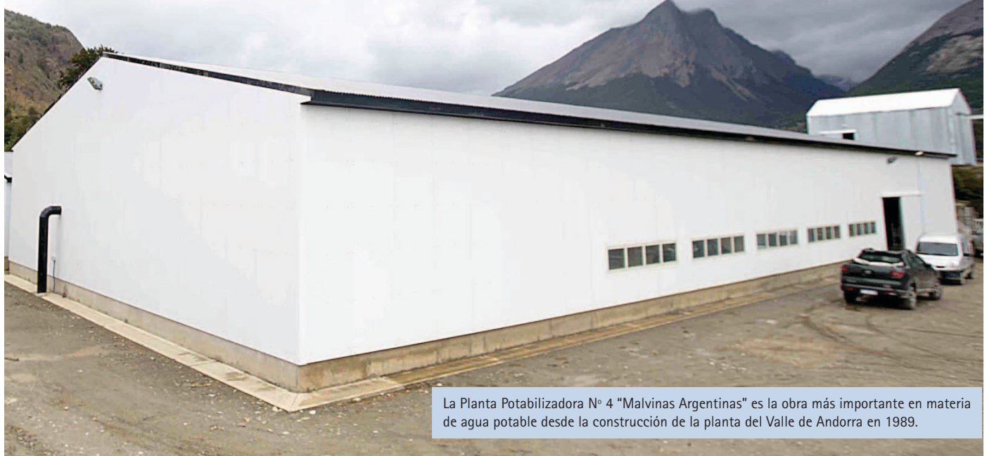
La Planta Potabilizadora N° 4 "Malvinas Argentinas" es la obra más importante en materia de agua potable desde la construcción de la planta del Valle de Andorra en 1989.

Adicionalmente, se producirá la disminución del riesgo de daño a los bosques cercanos provocados por una eventual emanación tóxica de cloro gaseoso a la atmósfera. También habrá un menor riesgo de daño a los cuerpos de agua de la zona y los ecosistemas que sostiene. ■