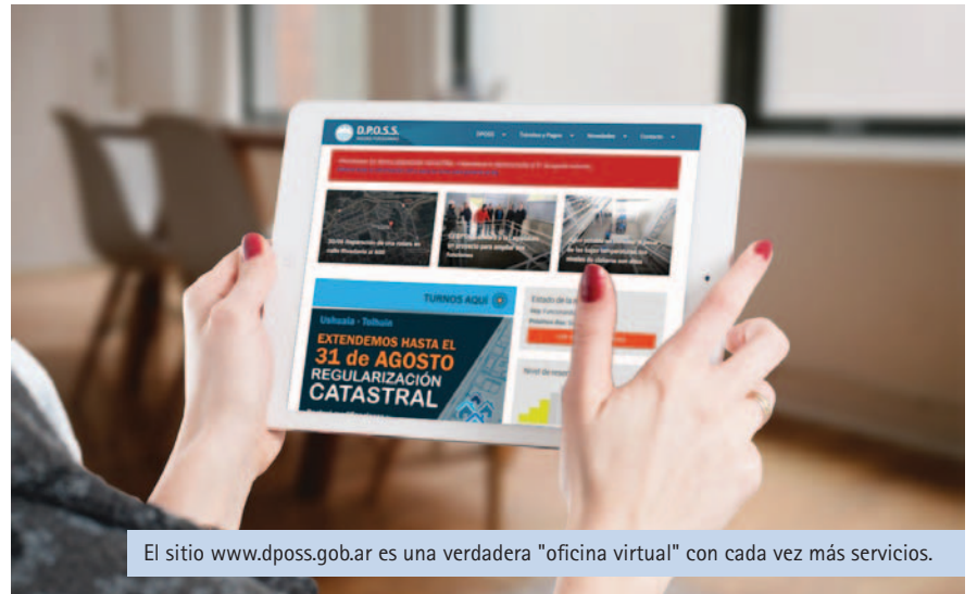
El sitio www.dposs.gov.ar es una verdadera "oficina virtual" con cada vez más servicios.

¿Consultas? ¿Reclamos? ¿Sugerencias? Tenemos un amplio abanico de vías de comunicación para vos.