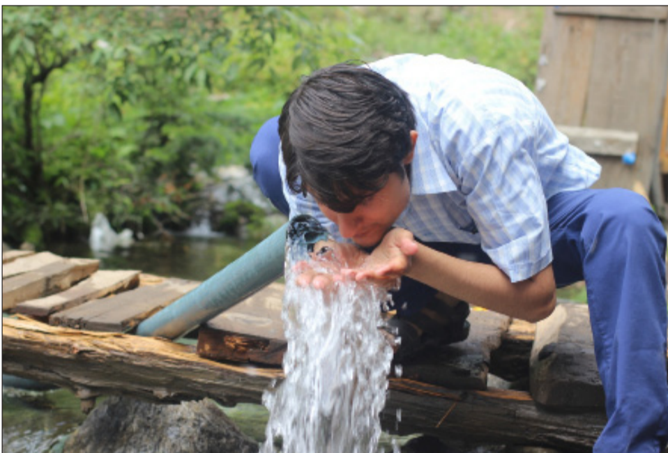
El 22 de Marzo sirve de inspiración para compartir los problemas relacionados con el agua y tomar medidas para cambiar la situación.

El Día Mundial del Agua nos da la chance de saber más sobre temas relacionados con este recurso; sirve de inspiración para compartir los problemas relacionados con el agua y tomar medidas para cambiar la situación.