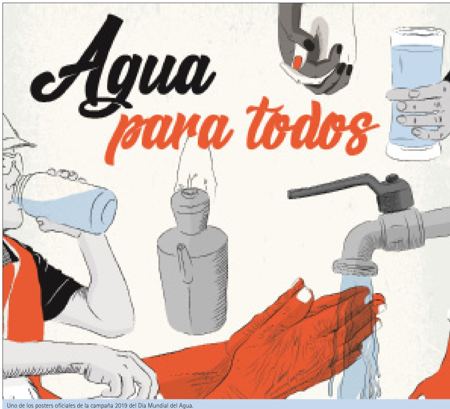
Uno de los posters oficiales de la campaña 2019 del Día Mundial del Agua.

enfocar nuestros esfuerzos hacia la inclusión de personas que han sido marginadas o ignoradas. Los servicios de agua deben satisfacer las necesidades de los grupos marginados y sus voces deben ser escuchadas en los procesos de toma de decisiones. Los marcos regulatorios y legales deben reconocer el derecho al agua para todas las personas, y la financiación suficiente debe ser justa y eficaz dirigida a quienes más lo necesitan.