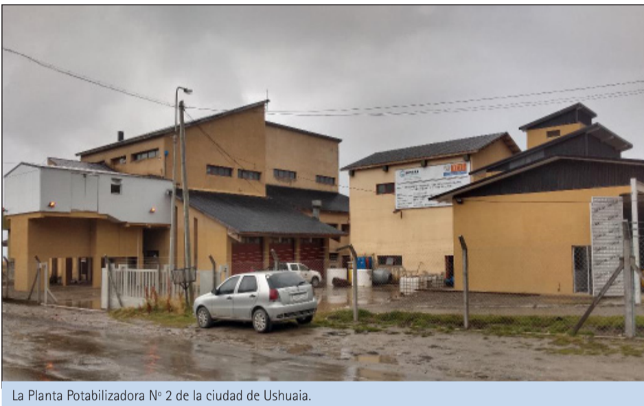
La Planta Potabilizadora N° 2 de la ciudad de Ushuaia.

Se trata del reacondicionamiento de los decantadores y filtros de la Planta Potabilizadora N° 2 "Buena Esperanza", lo que permitirá optimizar el proceso de potabilización. Y la construcción de una red de agua potable en el sector de calle Otero del barrio Akar y una red cloacal para el sector industrial en esa parte de la capital fueguina.