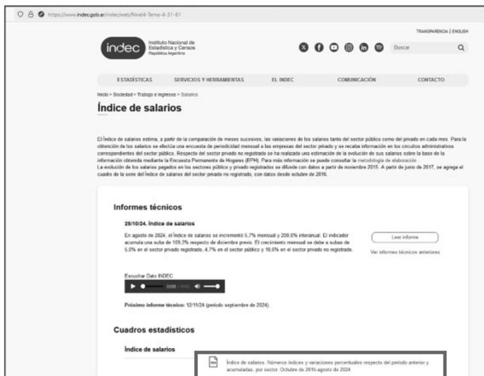
Ilustración 1- Acceso Cuadro ISNG

https://www.indec.gob.ar/indec/web/Nivel4-Tema-4-31-61